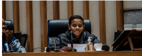
Representante do Projeto Onda em sua apresentação na Audiência Pública na CLDF em 07/11/25.

Os adolescentes do projeto representaram o Distrito Federal no Seminário Regional de Revisão e Elaboração do Plano Decenal dos Direitos da Criança e do Adolescente, e foram eleitos delegados para o Seminário Nacional em 2026.