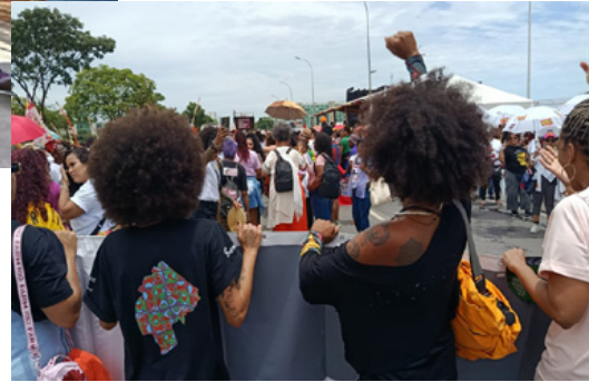
Participação de jovens do Mapa das Desigualdades na Marcha das Mulheres Negras.