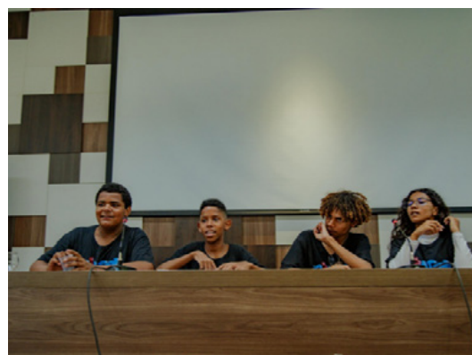
Adolescentes do Projeto Onda no Seminário Grito das Periferias no dia 15/11/25.

Por fim, adolescentes do projeto Onda também participaram ativamente do Seminário Grito das Periferias e apresentaram suas propostas para a Carta da Rede de Adolescentes e Jovens assinada em 15 de novembro a ser utilizada em 2026 para a continuidade das incidências junto ao GDF e aos candidatos ao governo.