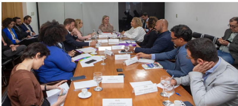
Audiência com a Ministra Gleisi Hoffmann de Relações Institucionais.

Diante desse cenário, apoiamos uma emenda ao projeto, que demandava pela incorporação da autodeclaração racial na declaração do imposto de renda. Também apresentamos, por meio de um gabinete parceiro, uma emenda supressiva com o objetivo de retirar os dispositivos introduzidos pelo relator, o deputado Arthur Lira (PP-AL), que excluía do cálculo do imposto mínimo determinados rendimentos financeiros, como aqueles vinculados ao agronegócio e as remessas de lucros e dividendos ao exterior por fundos de pensão estrangeiros.