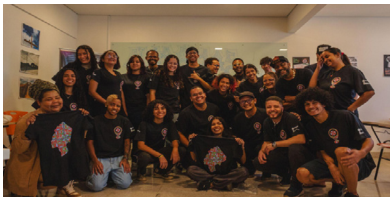
Oficina de formação.

Em 2025, o projeto Mapa das Desigualdades atendeu 39 adolescentes e jovens no ciclo de formação realizado pelo Inesc, alcançando 13 territórios periféricos do DF e do entorno. O grupo foi composto por 22 mulheres (1 trans) e 17 homens (2 trans), sendo que 32 eram pessoas negras, 1 era indígena e 6 eram brancas.