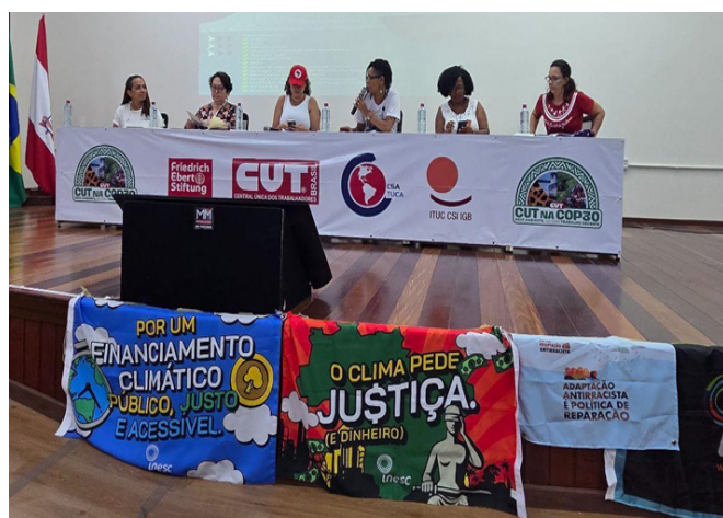
Atividade na Cúpula dos Povos.

Atuamos também de forma ampla na Cúpula dos Povos, desde a participação nos grupos de trabalho que construíram a Cúpula e na animação dos Eixos de Convergência, até a proposição, articulação e organização de atividades enlaçadas durante o evento. Contribuímos com o eixo de Reparação Histórica e Combate às Falsas Soluções de forma ativa, atuando na animação, construindo a agenda de atividades preparatórias e organizando os momentos presenciais, como a plenária e as atividades enlaçadas. Mantivemos o foco nas discussões sobre financiamento, gênero e adaptação climática, atuando com parceiros como CUT, Frente Brasileira contra os Acordos Mercosul-UE e Mercosul-EFTA, Federação de Órgãos para Assistência Social e Educacional (Fase), Rede Brasileira pela Integração dos Povos (Rebrip), Fundação Rosa Luxemburgo, entre outros.