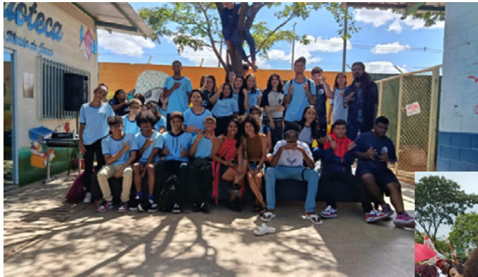
Atividade político-cultural no CED 1 do Riacho Fundo 2.