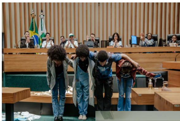
Audiência Pública Grito das Periferias na Câmara Legislativa do DF em 07/11/25. Participação de jovens na abertura cultural e à mesa de diálogos.

e como encaminhá-las junto ao GDF. Além disso, os próprios jovens elaboraram, de forma autogestionada, atividades político-culturais em seus territórios, de maneira a mobilizar a comunidade para a temática dos direitos humanos, principalmente no que diz respeito ao acesso à cultura, ao esporte e ao lazer.