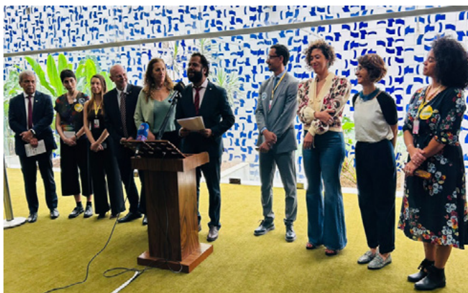
Lançamento do Manifesto em defesa da reforma renda no Congresso Nacional.

As emendas apresentadas ao Projeto de Lei nº 1.087/2025 não foram incorporadas ao texto final aprovado pelo Congresso Nacional. Ainda assim, avaliamos que as mobilizações populares e os processos de incidência política conduzidos ao longo da tramitação foram fundamentais para se evitar uma descaracterização mais profunda da proposta original e para a disputa de seu sentido político.