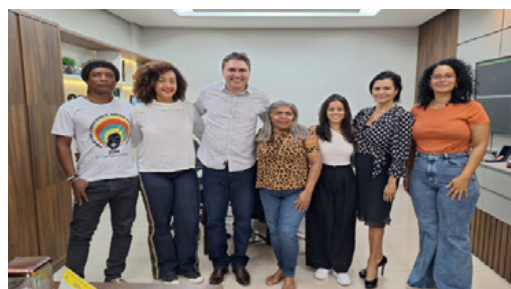
Reunião na Câmara Municipal de Marabá.

Com o objetivo de contribuir para a formação de lideranças mulheres de Marabá (PA), promovemos, em maio, uma oficina sobre políticas públicas de mulheres e igualdade racial, para formular um plano de incidência para o PPA 2026-2029 de Marabá. Fornecemos informações sobre a Compensação Financeira pela Exploração de Recursos Minerais (CFEM) destinada ao