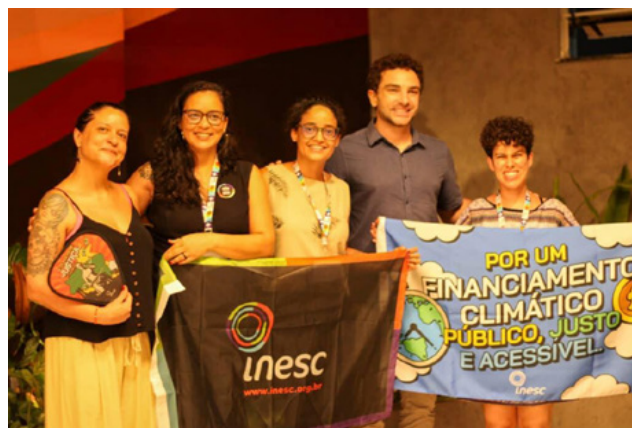
Parte da equipe do Inesc em Belém/PA, na COP 30.

A dificuldade de avançar em temas considerados meios de implementação – como regras, instrumentos e prazos para os acordos – mais uma vez foi marcada pela disputa entre os países ricos e os países em desenvolvimento, o que gerou impasses e dificultou o trabalho da diplomacia brasileira.