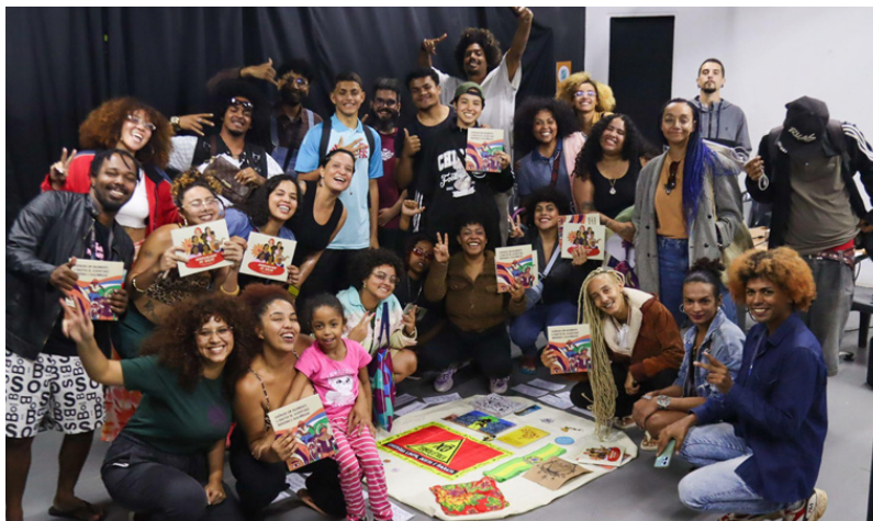
Oficina de formação em orçamento público na região de Ceilândia em 29/07/25.

Em 2025, o projeto Grito das Periferias teve o objetivo de formar e capacitar 75 adolescentes e jovens de 16 a 29 anos de idade moradores das Regiões Administrativas de Ceilândia, Estrutural e Itapoã (periferias do DF) nos temas de orçamento público, direitos humanos e direito à cidade na perspectiva de raça e gênero para influenciarem o orçamento público do Distrito Federal por meio de ações e incidências políticas.