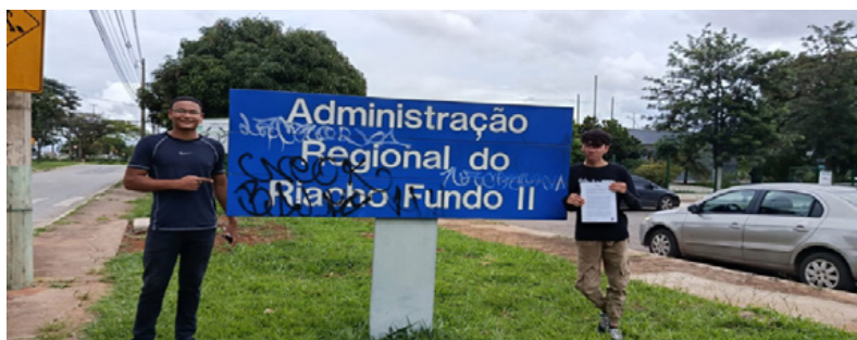
Atividade de Incidência.

O grupo também participou de uma audiência pública sobre o Plano Distrital de Educação e realizou reuniões com a Gerência Regional de Ensino da Candangolândia e a Administração Regional do Riacho Fundo 2, quando apresentou demandas como a construção de escolas de ensino médio, mais linhas de transporte público e a melhoria na iluminação do território. Além disso, o grupo enviou uma Carta de Recomendações ao Portal da Transparência do Distrito Federal .