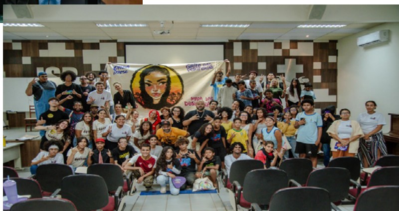
Seminário Grito das Periferias em 15/11/25.

Os jovens do Grito da Periferias também participaram ativamente da mobilização contra a construção de uma Usina Termoeletrica em Samambaia, que atingiria diretamente sua qualidade de vida. Por fim, realizamos o Seminário Grito das Periferias que recebeu adolescentes e jovens de vários territórios do DF para a construção de uma carta de propostas das juventudes ao GDF e para criação da Rede de Adolescentes e Jovens.