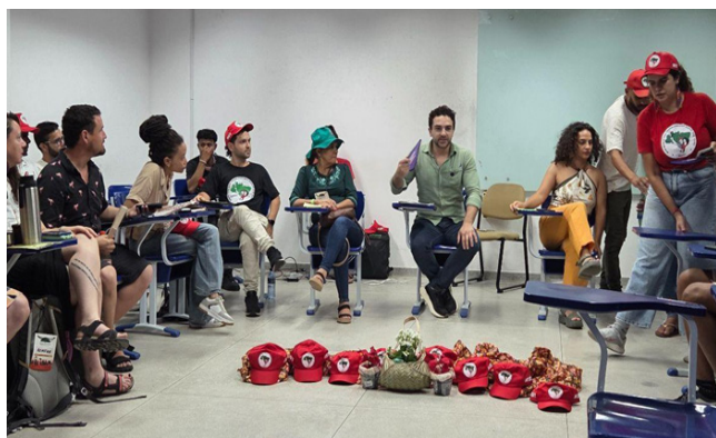
Atividade com o MST na Cúpula dos Povos.

A convite do Movimento dos Trabalhadores Rurais Sem Terra (MST), ainda no âmbito da Cúpula dos Povos, o Inesc participou de um diálogo que trouxe para o centro do debate sobre a Reforma Agrária o entendimento de que a transição energética constitui um elemento essencial e estratégico para garantir a permanência dos trabalhadores no campo, assegurar a segurança alimentar e hídrica e fortalecer a adaptação frente às mudanças do clima. No entanto, é fundamental que se construa uma visão estratégica da transição energética para a Nação e, conseqüentemente, para a população brasileira.